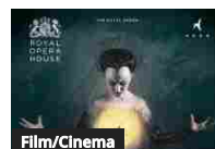
Film/Cinema Il Flauto Magico - Live from Royal Opera House