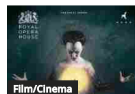
Film/Cinema Il flauto magico - Live from Royal Opera House

Alla fase di ricerca che vedrà impegnati questi e altri artisti in confronto diretto con atleti e sportivi seguirà un percorso di networking tra piccole e medie imprese italiane e francesi. Il risultato della misurazione di un legame diretto del mercato turistico con l'industria culturale, ovvero l'attraversamento di uno di quei confini probabilmente più audaci dei limiti nazionali, sarà oggetto di una conferenza sul tema dell'innovazione culturale nei confronti del territorio: come anticipato da Enrico Camanni, Vice Presidente dell'Associazione