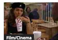
Film/Cinema Venerdì black cult