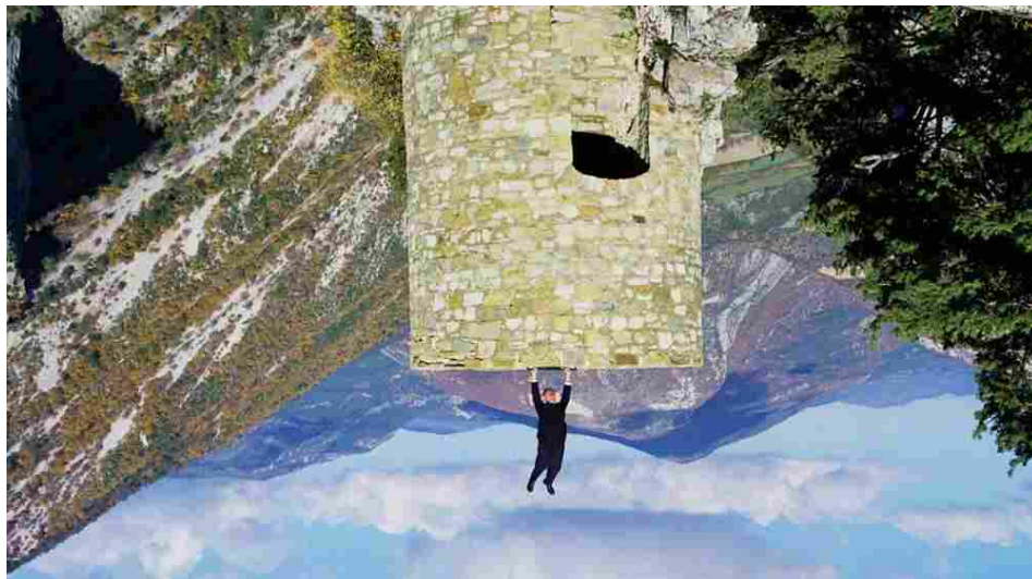
Philippe Ramette, Inversion de pesanteur, 2003.